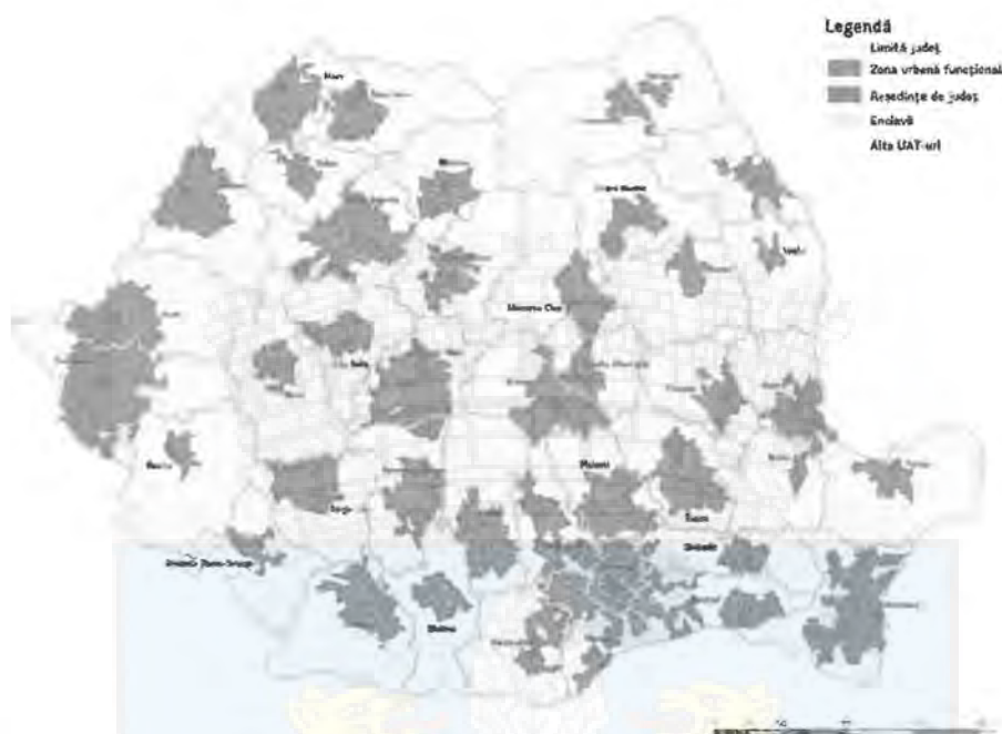
Figura 38. Zonele urbane funcționale ale Bucureștiului și ale reședințelor de județ